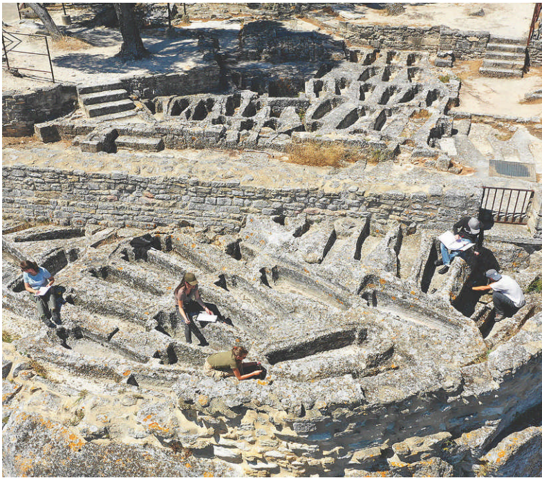
LE PITON ROCHEUX domine la vallée du Rhône, entre Provence et Camargue.